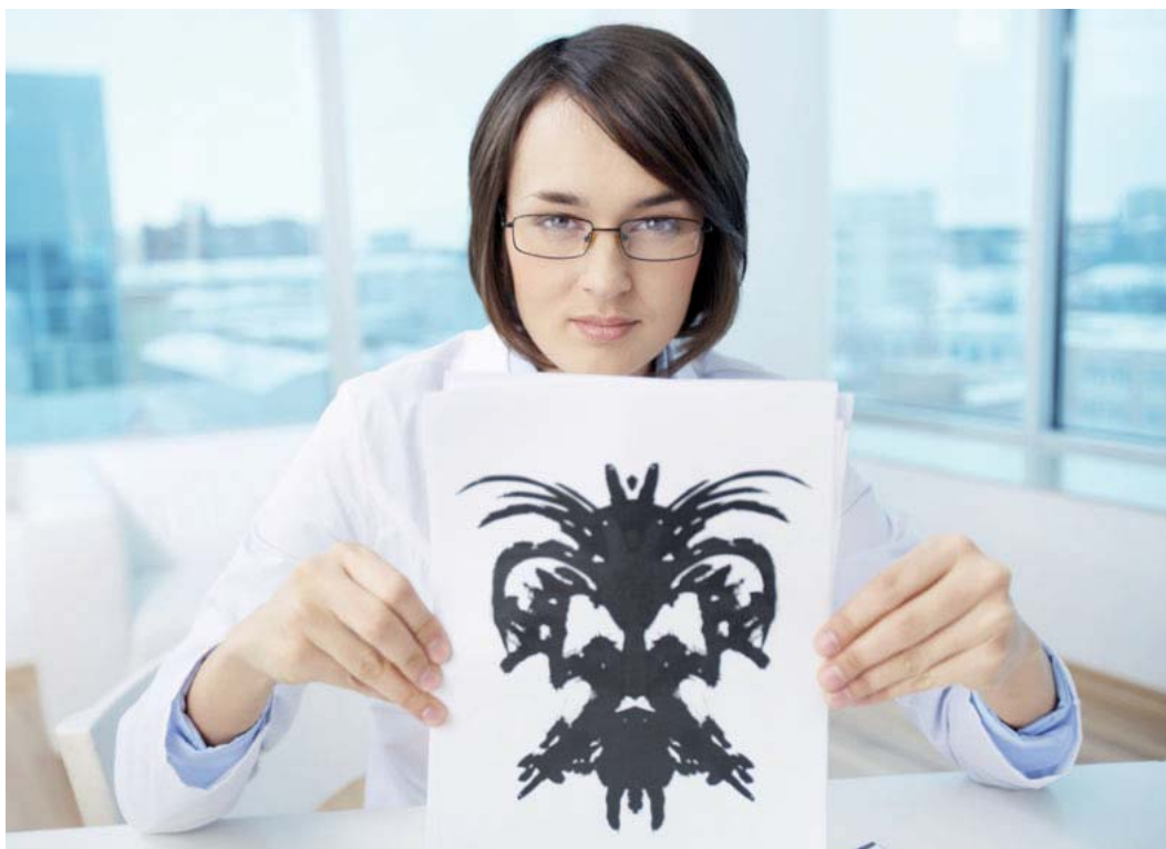
Abb. 1.2: Rorschach-Test