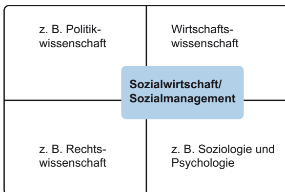
Abb. 1.2: Schwerpunktmaige Vorortung der Sozialwirtschaft bzw. des Sozialmanagements